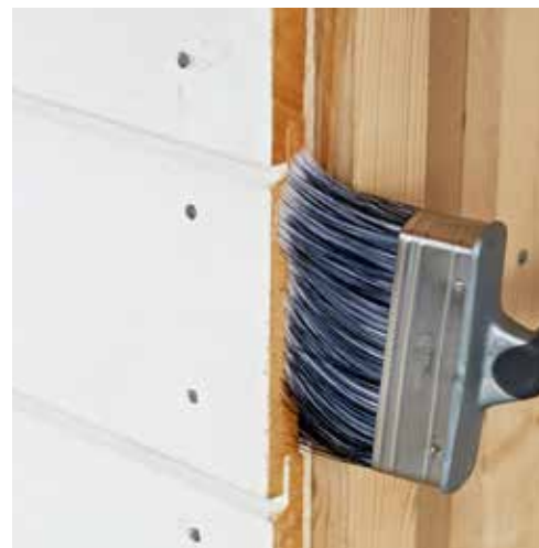
Husk å behandle endevved med Visir før toppstrøket.