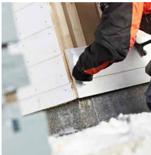
Kledningen er beskyttet, helt uavhengig av årstid.