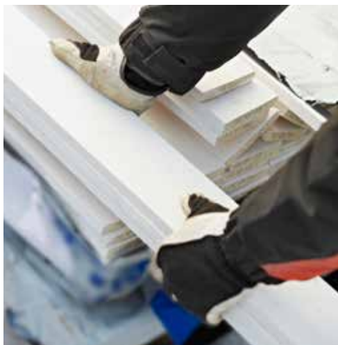
Frigjør verdifull tid ved å velge fabrikkmalt kledning.

Snakk med ditt lokale byggvarehus for bestilling av fabrikkmalt kledning. Kledningen er grunnet og påført første malingsstrøk i ønsket farge. Fabrikkmalt kledning har kort leveringstid fra leverandør. Husk å ta med ønsket fargekode når du skal bestille kledningen.